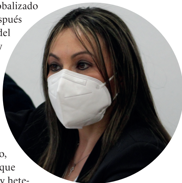
Estado de México

Un elemento central de inclusión desde una perspectiva decolonial es que la educación básica forme ciudadanos que aprendan que la naturaleza es exterior a la sociedad, lo que requiere que construyan relaciones sociales en el marco de la naturaleza, así como relaciones ambientales en la que están incorporados