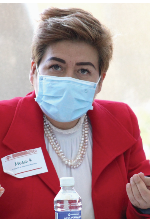
Estado de México

Se evalúa para poner en evidencia el trayecto recorrido y el que falta por andar, con el fin de emitir una valoración pertinente siempre provisional. Con esto se hace hincapié en que la evaluación de los aprendizajes y la acreditación de dichos aprendizajes responden a dos momentos diferentes.