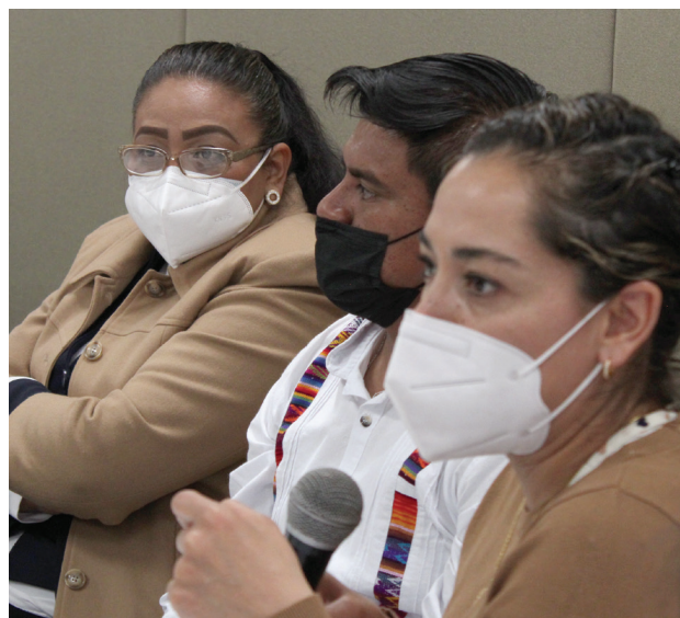
San Luis Potosí

Por otra parte, se puede desarrollar una ética de diálogo cimentada en valores como la reciprocidad, el reconocimiento, el respeto y la interacción con el otro en su diversidad; en la justicia social, la libertad creativa y la solidaridad. De la misma manera, se expresa a partir de la construcción de proyectos de servicio e intercambio solidario entre la escuela y la comunidad-territorio a partir de la reapropiación de los conocimientos, experiencias, saberes y prácticas aprendidas durante los procesos formativos, dentro y fuera del espacio escolar.