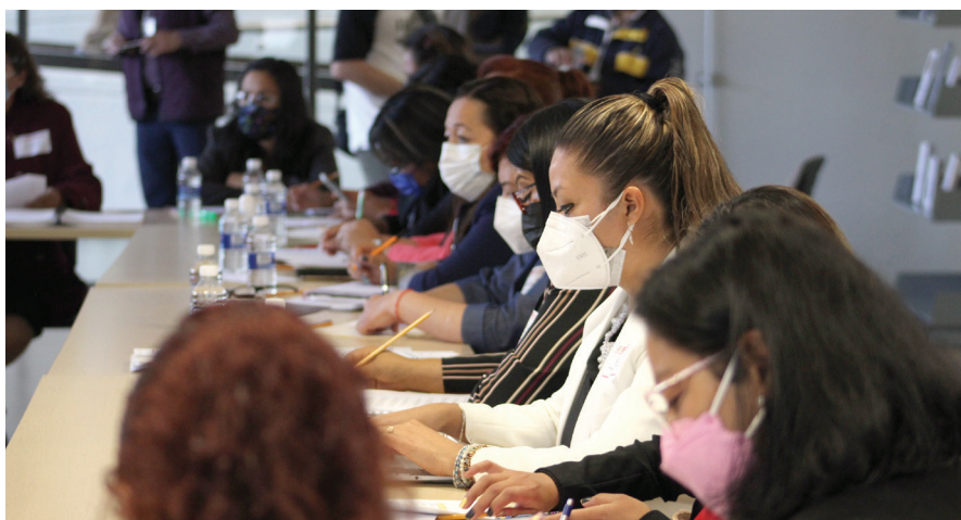
Estado de México

El eje de artes y experiencias estéticas favorece la creación de un ambiente estético en las escuelas a partir de las manifestaciones culturales propias de las comunidades, en cuya producción todos y todas puedan participar. Permite aprovechar los artefactos, materiales y recursos de las artes para promover experiencias estéticas en los momentos de exploración, experimentación y apreciación. Pueden considerarse, entre otros, el movimiento, el sonido, la expresión corporal y verbal, la composición escrita de poemas y relatos, la experimentación con el color y el uso de las formas, la producción de instalaciones, videos, performances, o el uso de objetos cotidianos de modos no cotidianos.