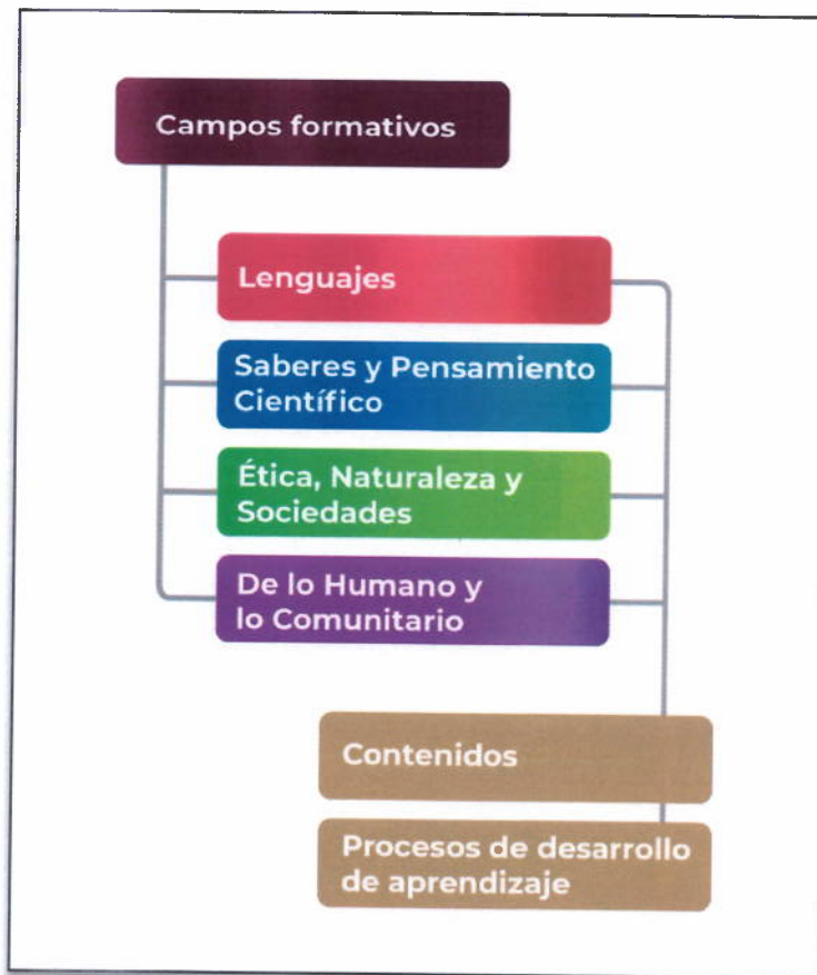
Elementos curriculares de los Programas Sintéticos

Esta organización impulsa una mayor autonomía profesional que fomenta el diseño de propuestas contextualizadas en las que se problematice la realidad y se atienda a las características, necesidades e intereses de niñas, niños y adolescentes.